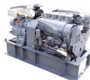
Дизельный винтовой компрессор